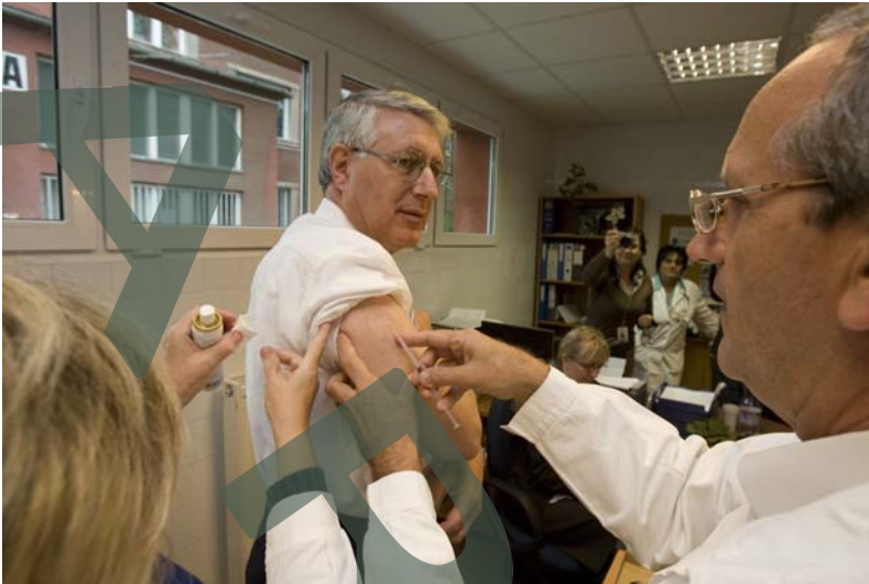
A tű beszúrása és nagyítása