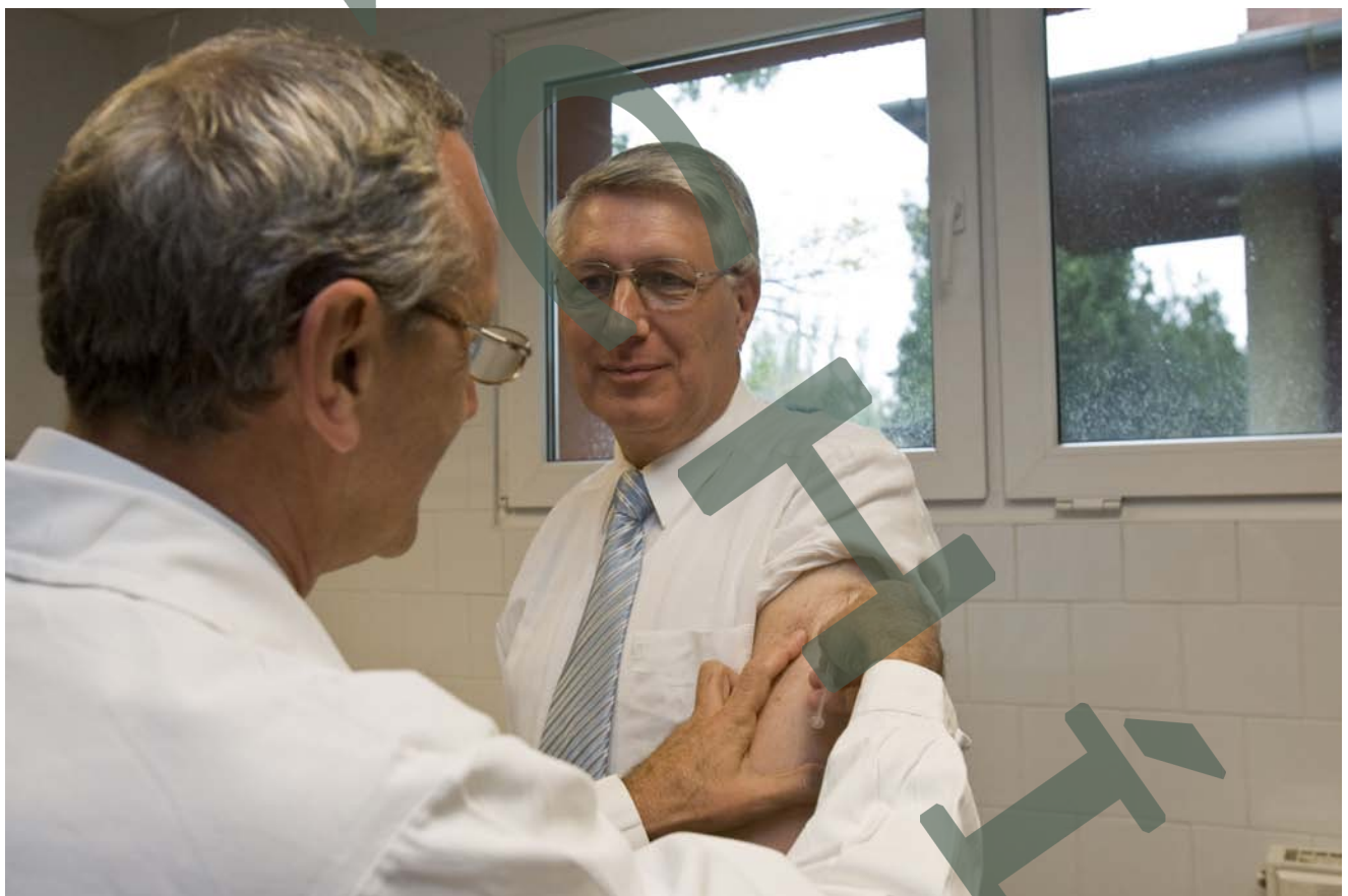
A bal kar oltása a másik vakcinával

Az ÁNTSZ oltási sajtótájékoztatójának videófelvetele letölthető a www.freepress.hu honlapról is. Link: http://www.freepress.hu/hun/hun/report/view/beoltottak_a_foorvost/