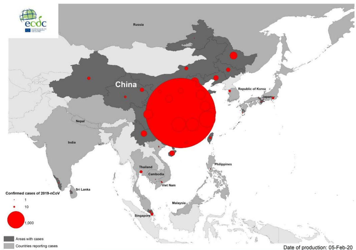
2. ábra: A 2019-NCoV okozta igazolt megbetegedés által érintett országok (ECDC 2020.02.05.)